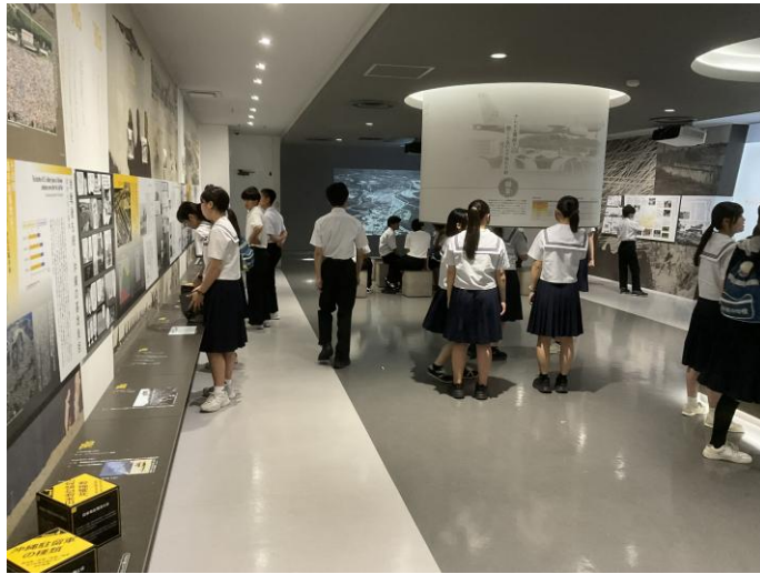
< 学習展示室 ① >