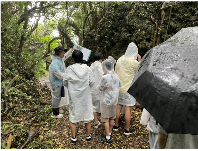
< ホロホローの森 散策 >