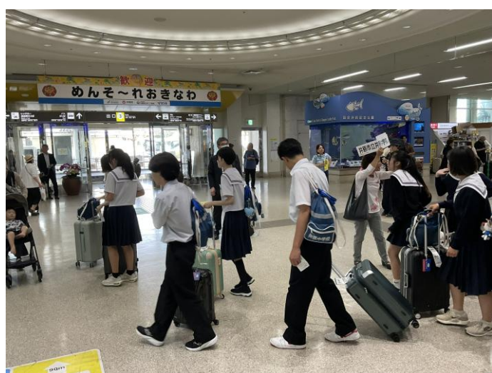
< 那覇空港到着 >