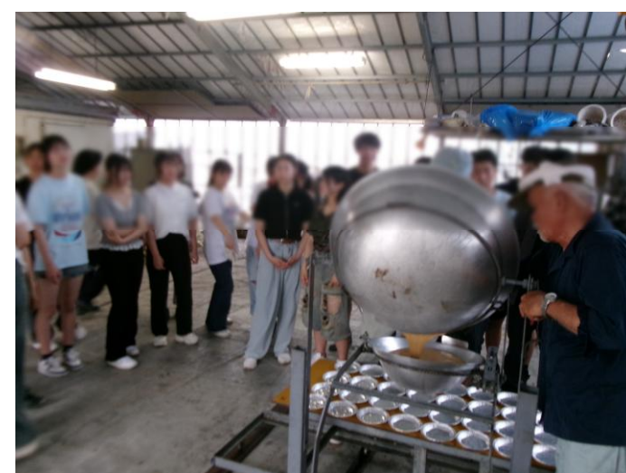
< 黒糖づくり ③ >