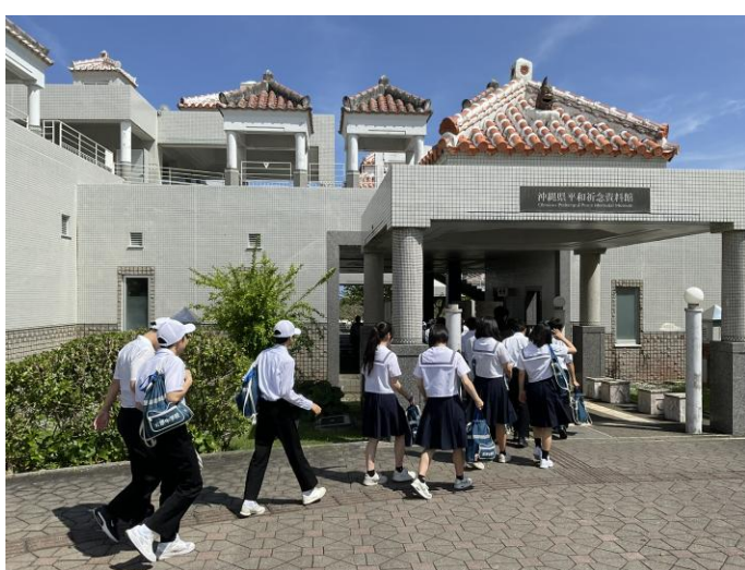
< 平和祈念資料館 >