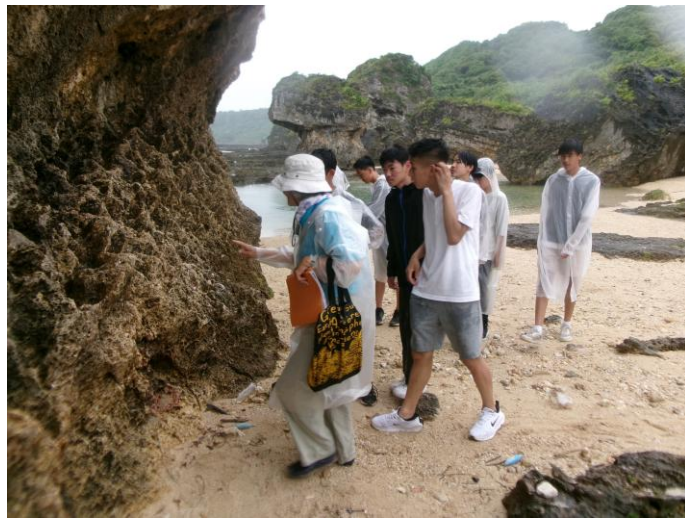
< 具志頭浜 散策 ① >