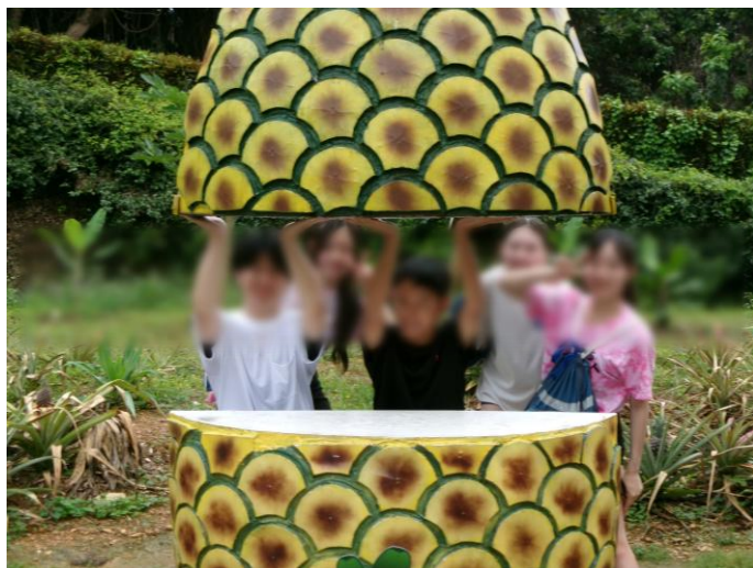
< 熱帯フルーツ園 ① >