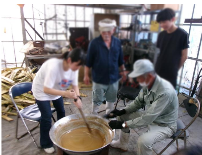
< 黒糖づくり ② >