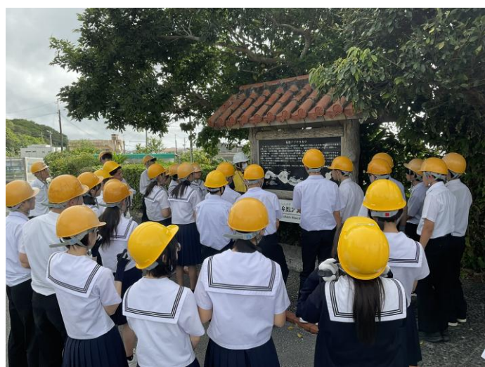
< アブチラガマ >