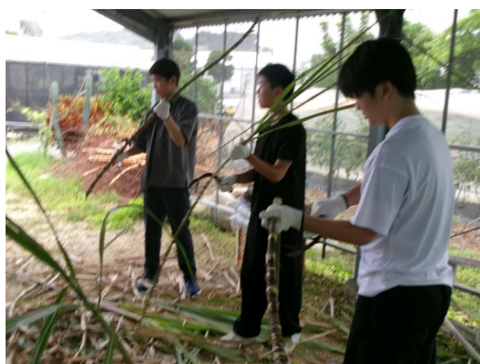
< 黒糖づくり ① >