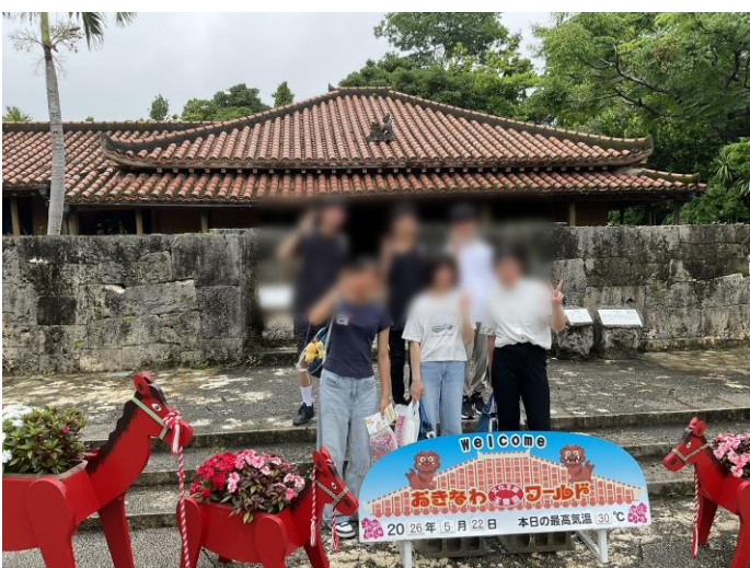
< 琉球王国城下町 >