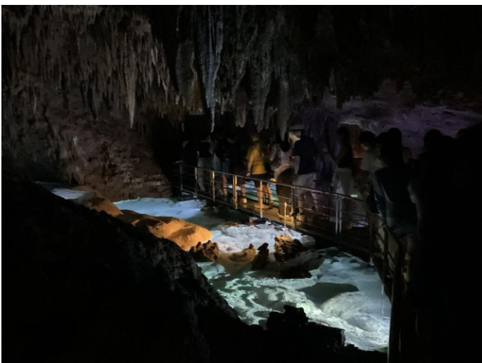
< 玉泉洞 >