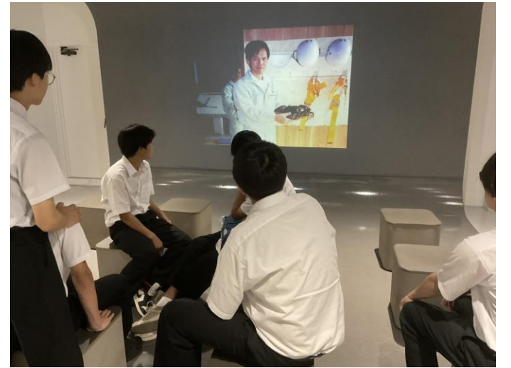
< 学習展示室 ② >