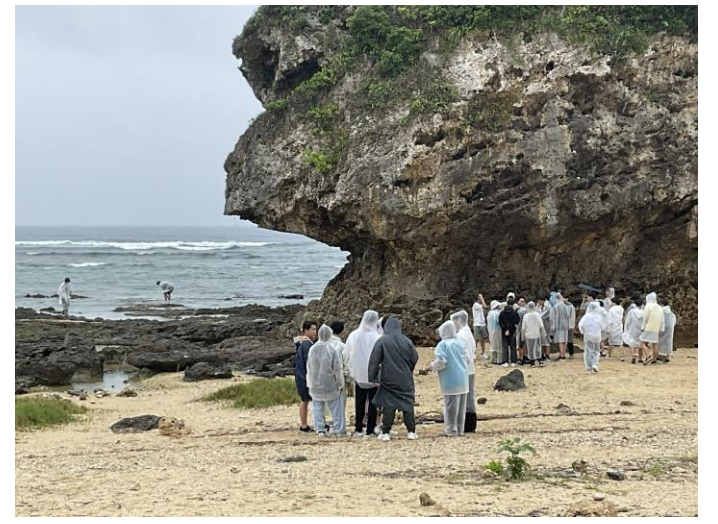
< 具志頭浜 散策 ② >