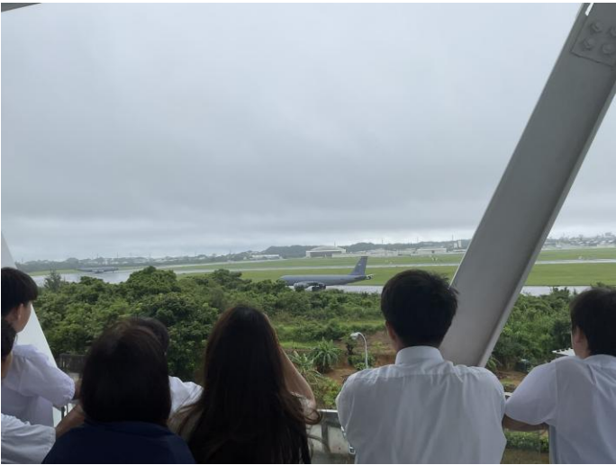
< 展望台 >