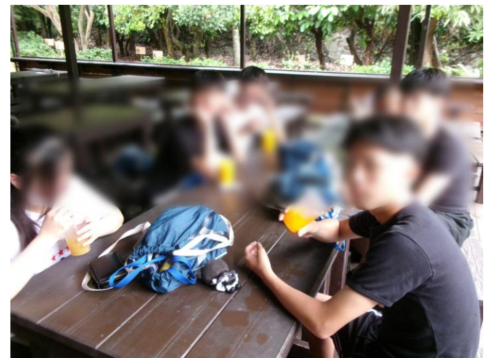
< 熱帯フルーツ園 ② >