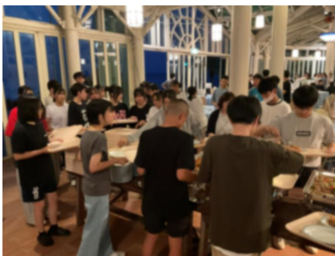
< リザンシーパークホテル谷茶ベイにて夕食 >