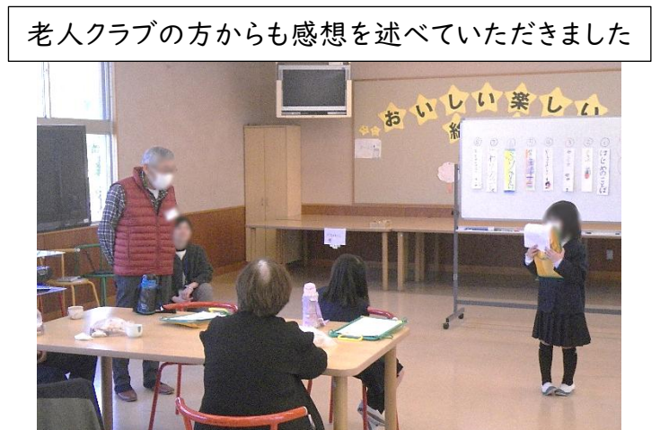
老人クラブの方からも感想を述べていただきました