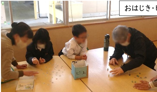
おはじき・ビー玉

1年生が、老人クラブ連合会の方と一緒に昔遊びを楽しみました。その後、高ランチルームで交流会を開き、和やかで楽しい時間を過ごしました。子どもたちが、昔遊びを通して地域の方と触れ合う姿は、とても微笑ましいものでした。老人クラブ連合会の皆様、ありがとうございました。