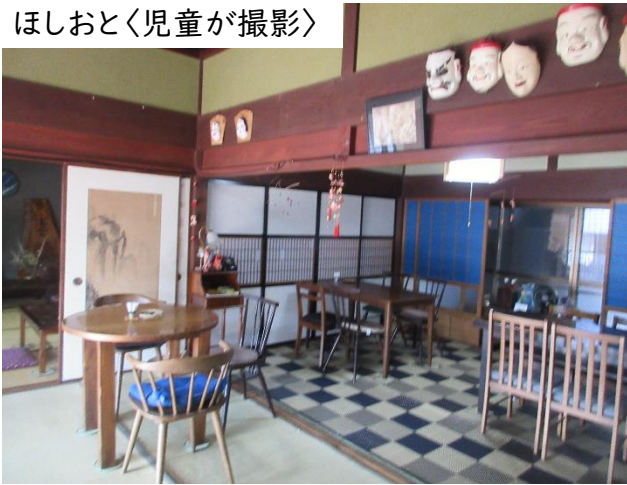
ほしおとく児童が撮影〉