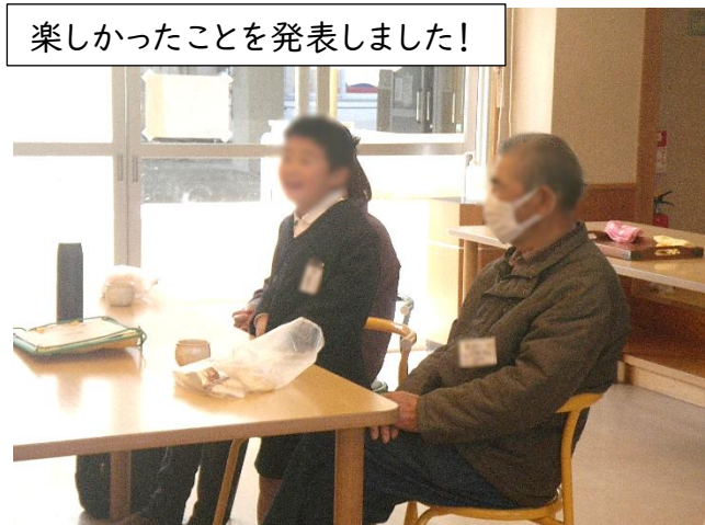
楽しかったことを発表しました!