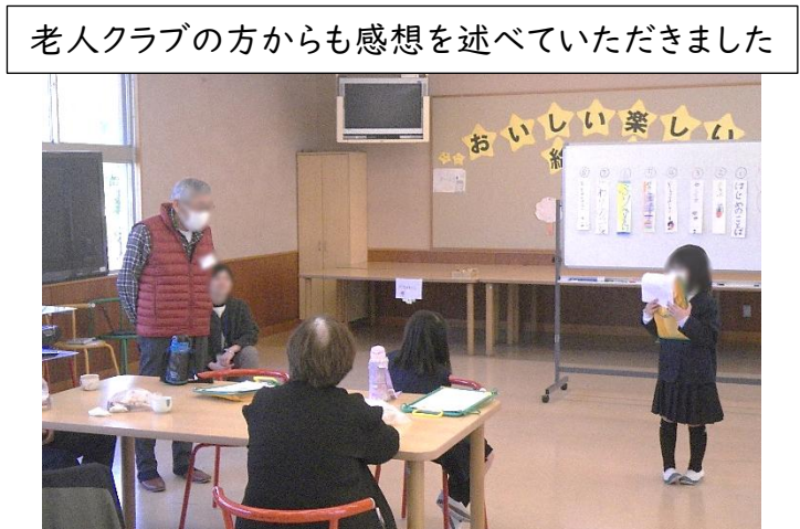
老人クラブの方からも感想を述べていただきました