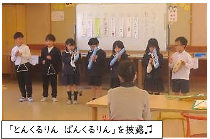
「とんくるりん ぱんくるりん」を披露♪