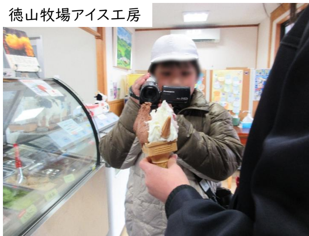
徳山牧場アイス工房