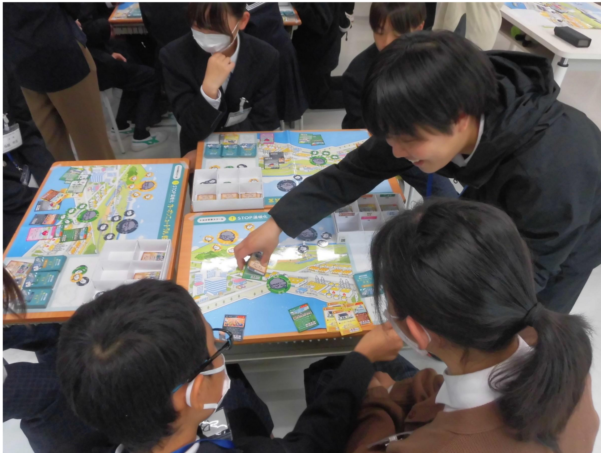
【1年生】トヨタ未来スクール 「STOP温暖化！カーボンニュートラル実験教室」