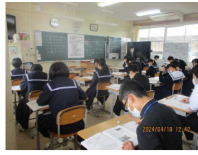
○20240418_全国・県・市学力調査