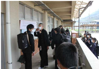
○20240408_クラス発表・始業式