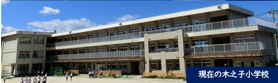
現在の木之子小学校