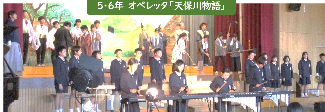
5・6年 オペレッタ「天保川物語」