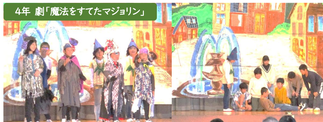
4年 劇「魔法をすてたマジヨリン」