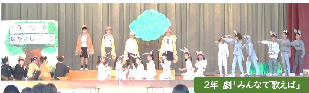
2年 劇「みんなで歌えば」