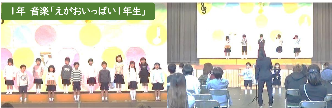
1年 音楽「えがおいっぱい!年生」