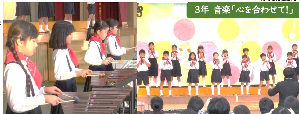
3年 音楽「心を合わせて!」

保護者の皆様には、健康管理・衣装の準備等で、大変お世話になり、ありがとうございました。