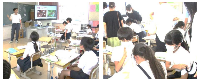
3年理科「こん虫のすみか」 6年算数「どんな計算になるかな」