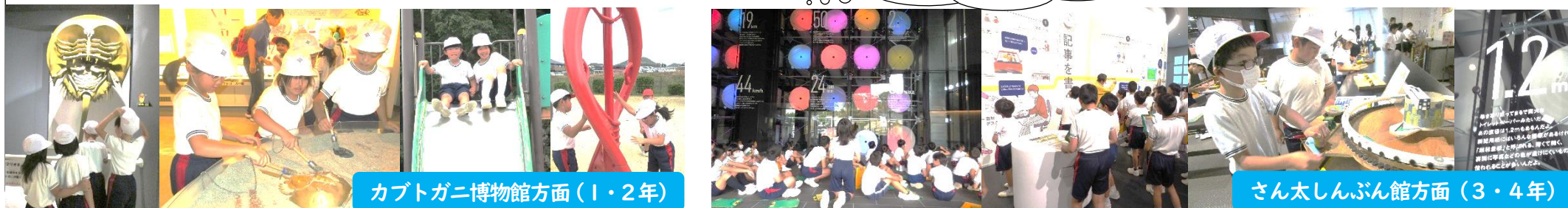
カブトガニ博物館方面(1・2年)