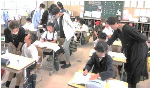
4年「花をさかせた水がめの話」

6月6日(火)は、人権参観日を実施しました。思いやりや親切などの内容を取り上げた道徳の授業を公開しました。今後、6年間を通していろいろな人権にかかわる問題に向き合い、みんなが幸せに生活するためにはどうすればよいのかを考えていきます。