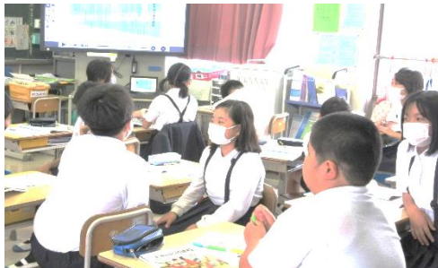
5年「いじめをなくすために」