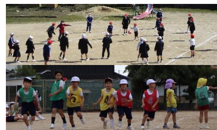
クラブ活動・リレー集会

基本的な生活習慣を身に付け、メディアコントロールができるように指導しています。また、体育の時間や休み時間を有効に活用して、体力の向上を目指しています。