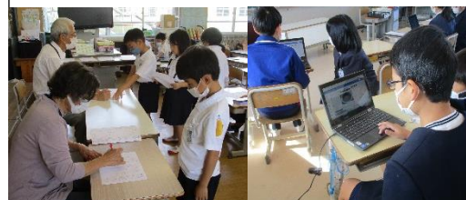
放課後学習・タブレットの活用

子どもたちの落ち着いた生活を基盤とし、学力向上に向けて、様々な活動に取り組んでいます。 ・朝学習や放課後学習、慎思タイム ・ICT機器の活用・きのこの約束