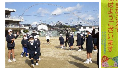
縦割り班での活動・あいさつ運動

仲間づくりを大切に、思いやりのある心や温かい人間関係を育成していきます。気持ちのよいあいさつが広がり、毎日楽しく学校に来ることができるよう努めます。