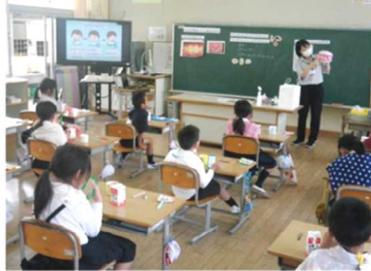
養護教諭と学習する2年生