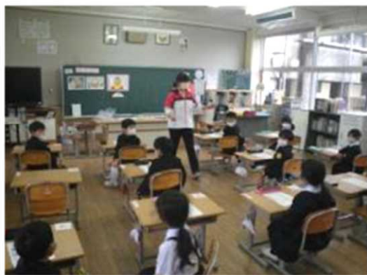
栄養教諭と学習する1年生

今後も、栄養教諭や養護教諭などの専門性を生かして、児童の学習を充実させたいと思います。