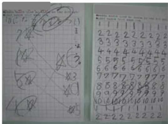
1年生 自主学习のコピー

子供たちは、家庭学習を頑張っています。美星小では、「家庭学習＝宿題＋自主学习」と考えています。学年によっては、帰りの会で連絡帳に「家庭学習の時間」と「自主学习のめあて（内容）」を書いて帰っています。お忙しいと思いますが、子供たちの家庭学習の様子をしっかり見ていただき、頑張っていたら、しっかり認めて褒めていただきたいと思います。どうぞ、よろしくお願いいたします。