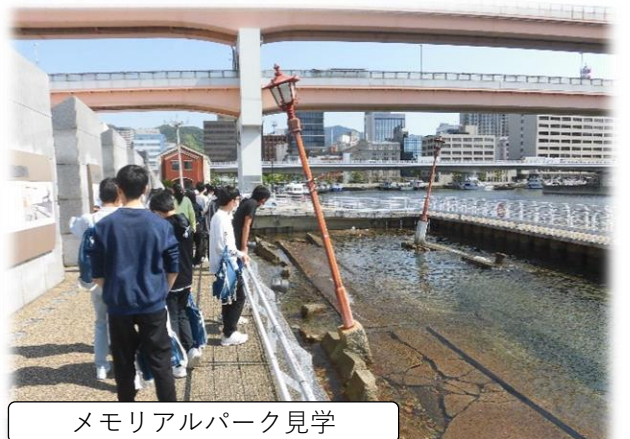
メモリアルパーク見学