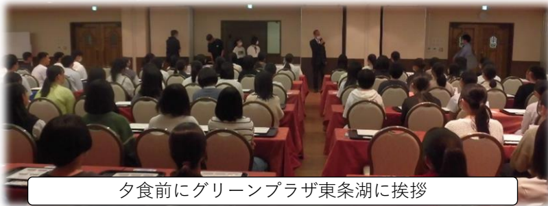
夕食前にグリーンプラザ東条湖に挨拶