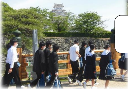
国宝・世界遺産の姫路城へ！ ガイドさんの案内で城内巡り