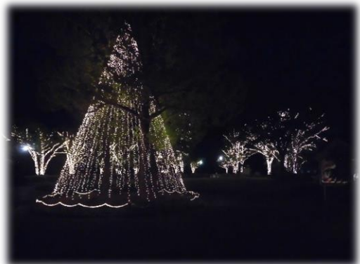
レストランの外はイルミネーションがとてもきれいでした