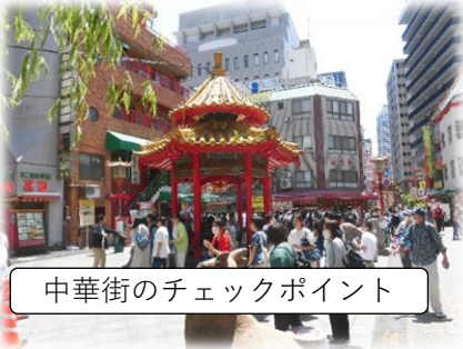
中華街のチェックポイント