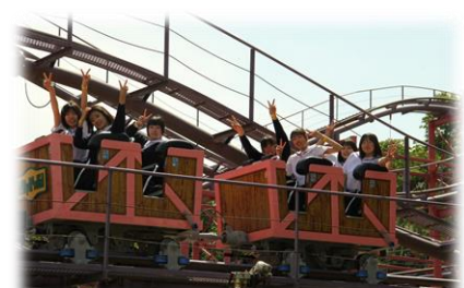
遊園地ではジェットコースターなどでスリルを味わっていました

3日間天気に恵まれ、全員元気に帰ってくることができました。 引率して下さった先生方や旅行費用を負担して下さった保護者の方に感謝するとともに、 この経験・体験を今後の学校生活に生かしてくれることを期待しています。