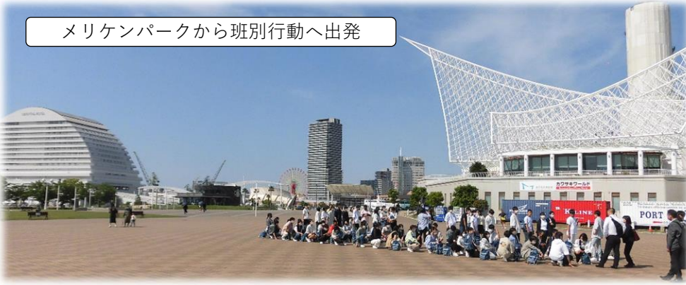
メリケンパークから班別行動へ出発