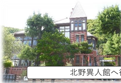
北野異人館へ行った生徒も