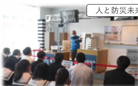
人と防災未来センターで防災学習