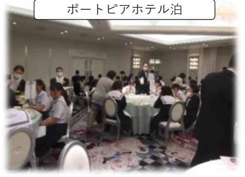
ポートピアホテル泊