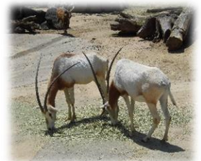
姫路セントラルパークでドライブスルーサファリを満喫