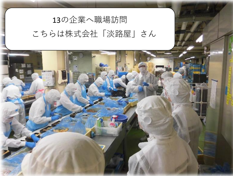
13の企業へ職場訪問 こちらは株式会社「淡路屋」さん